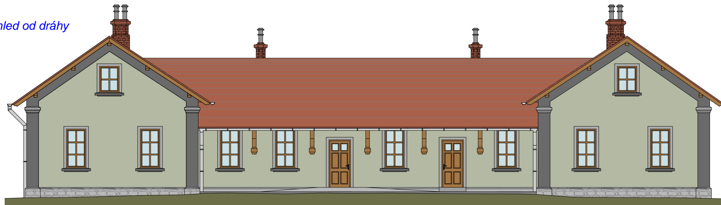
Pohled od dráhy