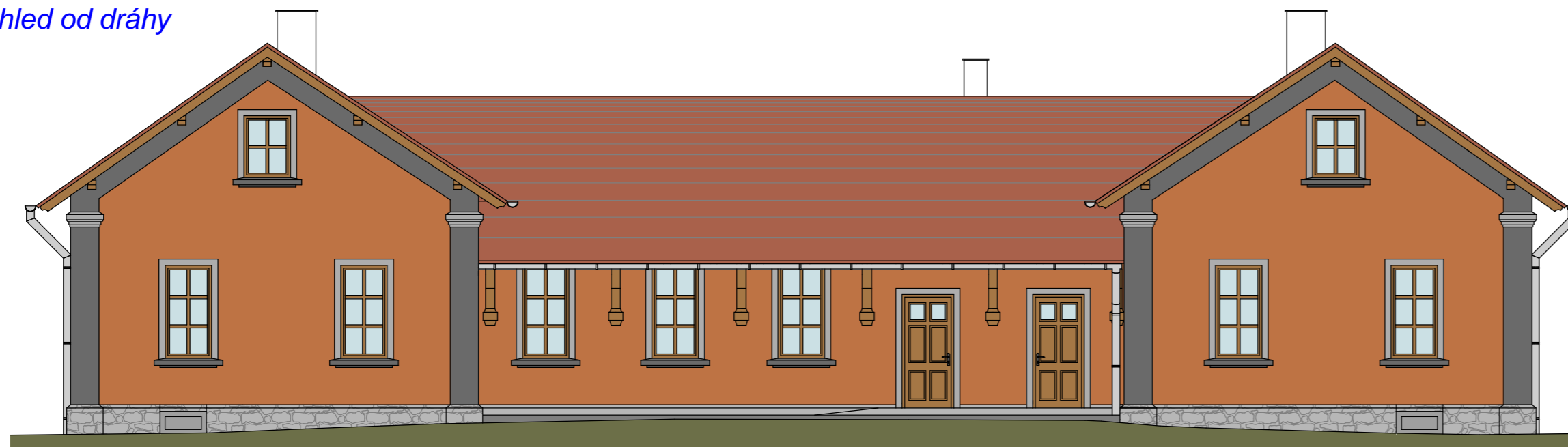
Pohled od dráhy